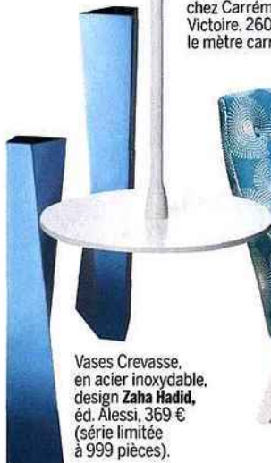
Vases Crevasse , en acier inoxydable, design Zaha Hadid , éd. Alessi, 369 € (série limitée à 999 pièces).