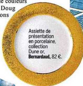
Assiette de présentation en porcelaine, collection Dune or , Bernardaud , 82 €.