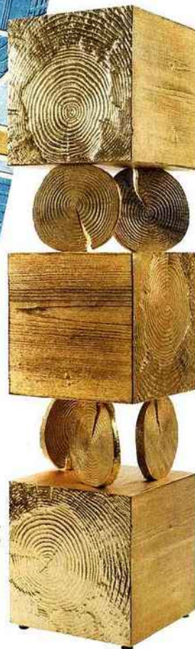
Cabinet de rangement Totem , en fonte d'aluminium, design Andrea Salvetti , galerie Avant-Scène prix sur demande.