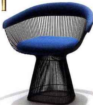
Fauteuil en fils d'acier, design Warren Platner , éd. Knoll, à partir de 2400 €.