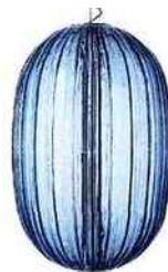
Suspension Plass , en polycarbonate, design Luca Nichetto , éd. Foscarini, 1850 €.