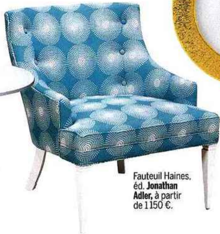
Fauteuil Haines , éd. Jonathan Adler , à partir de 1150 €.