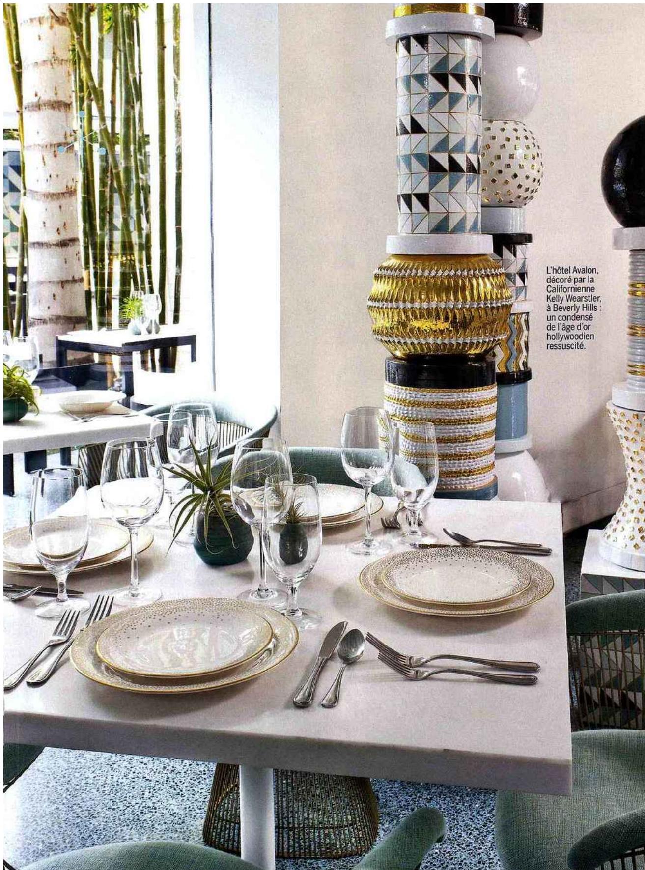
L'hôtel Avalon, décoré par la Californienne Kelly Wearstler, à Beverly Hills : un condensé de l'âge d'or hollywoodien ressuscité.