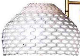
Lampadaire Tatou , design Patricia Urquiola , éd. Flos, 850 €.