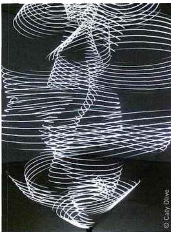
« Etudes de Fluides », Caty Olive, 2012

Formée à l'École nationale supérieure des arts décoratifs de Paris (ENSAD), Caty Olive crée des scénographies lumineuses au sein de projets d'architecture, d'installations plastiques et de spectacles chorégraphiques. Elle s'intéresse tout particulièrement aux mouvements de glissement et de vibration de la lumière. Profitant des caractéristiques de l'espace de la galerie