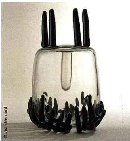
(Ci-dessus) A. Ettore Sottsass, Kachina 10 (2006-2012). Réalisation Centre international de recherche sur le verre et les arts plastiques (CIRVA), Marseille, édition Galerie Mourmans, Maastricht (Pays-Bas). (Ci-contre) E. Sottsass dans l'atelier du CIRVA (2000).

Grand Hornu Images consacre à Mathieu Lehanneur sa première exposition monographique. Personnalité singulière de la planète design, il se passionne très tôt pour les interactions entre le corps et son environnement, les systèmes vivants et le monde scientifique. Dans une mise en scène personnelle et spontanée, l'exposition dévoile la façon dont le designer explore les possibilités naturelles et technologiques qui lui permettent de produire des objets aussi fonctionnels que magiques, à la fois étranges et amicaux. Jusqu'au 31 mars 2013, au Grand-Hornu Images, 82 rue Sainte-Louise, 7301 Hornu, Belgique. www.grand-hornu-images.be