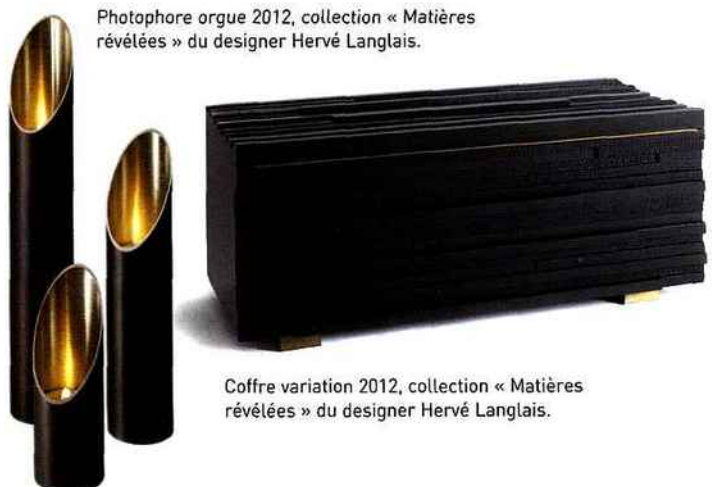
Photophore orgue 2012, collection « Matières révélées » du designer Hervé Langlais.

La galerie Curiosités d'Esthètes a pour but de renouer avec les arts décoratifs à la française en mariant avec talent art, design et savoir-faire innovants afin de présenter des créations exceptionnelles réalisées par des artisans aux savoir-faire inégalés. Une manière de retrouver l'approche luxueuse des maîtres des années 30 et 40 dans la veine de Jean-Michel Frank ou Jacques Quinet. Preuve en est, l'exposition « Matières révélées », qui dévoile la première collection de mobilier signée Hervé Langlais, des pièces exclusives qui traduisent sa double expérience d'architecte et de designer. À partir de janvier 2013 à la galerie Curiosités d'Esthètes , 60 rue de Verneuil (côté Musée d'Orsay), 75007 Paris.