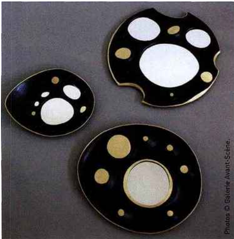
Miroirs lunaires, Franck Evenou.